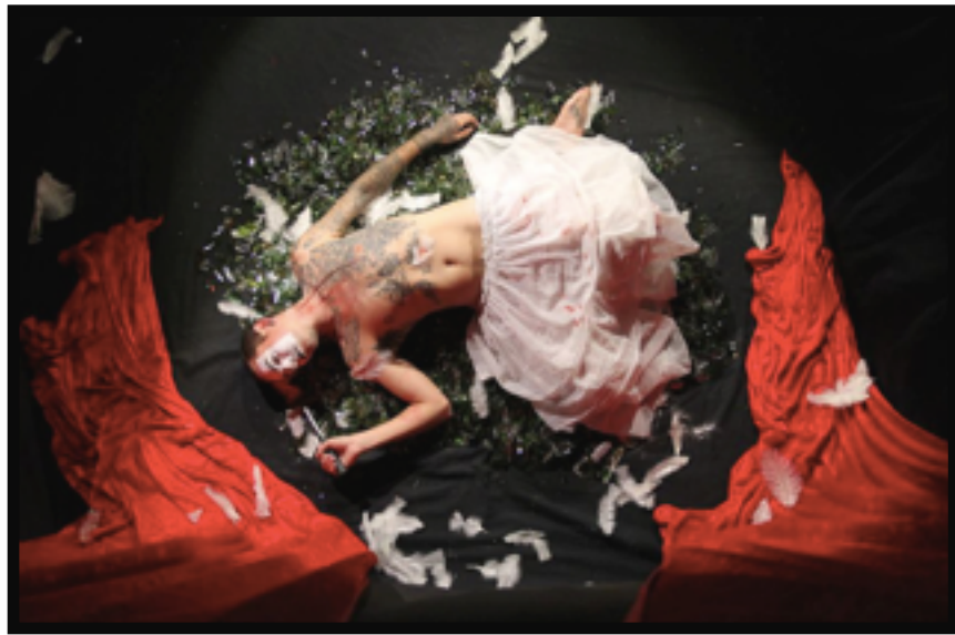
Don't Pray For Us (film)