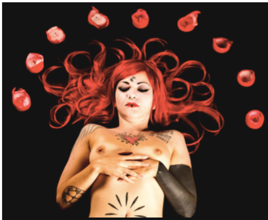
Pagan Variations (film)